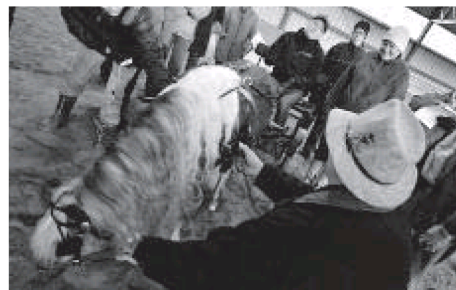
L'atelier du 7 juin prochain démystifiera la discipline de l'attelage de plaisance.