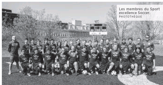
Les membres du Sport excellence Soccer.

Du septembre à novembre, l'accent est mis sur le soccer extérieur à 11 joueurs tant sur un terrain synthétique que naturel. À partir du mois de décembre jusqu'au mois de mars, les entraîneurs enseignent les rudiments du soccer intérieur de type Futsal en